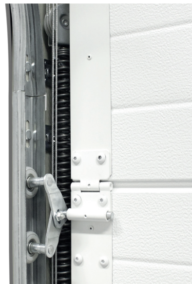
Ressort dans rail latéral et galets Tandem