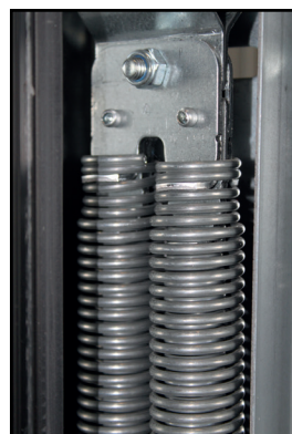
8 ressorts au lieu de 4 pour plus de résistance