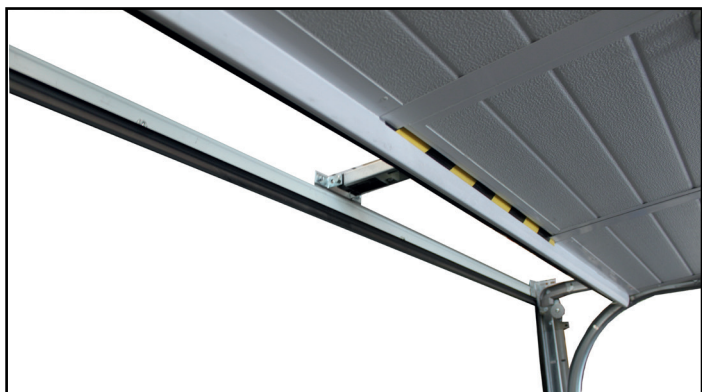
Faible retombée de linteau : 100 mm