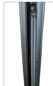
Grappe ressort Duplex dans rails