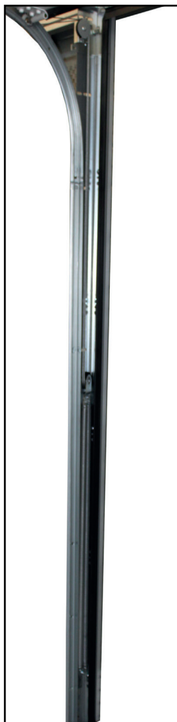
Ressort, câble et poulie montés