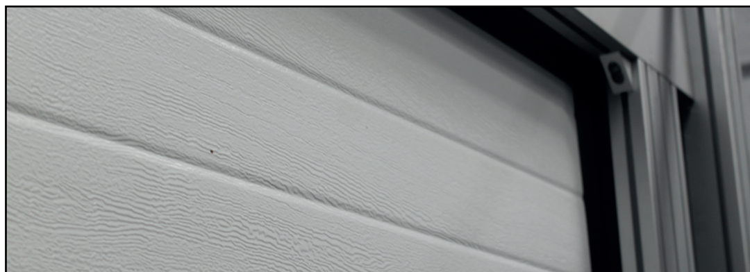
Encadrement noir par joint recouvrant : évite les rayures !