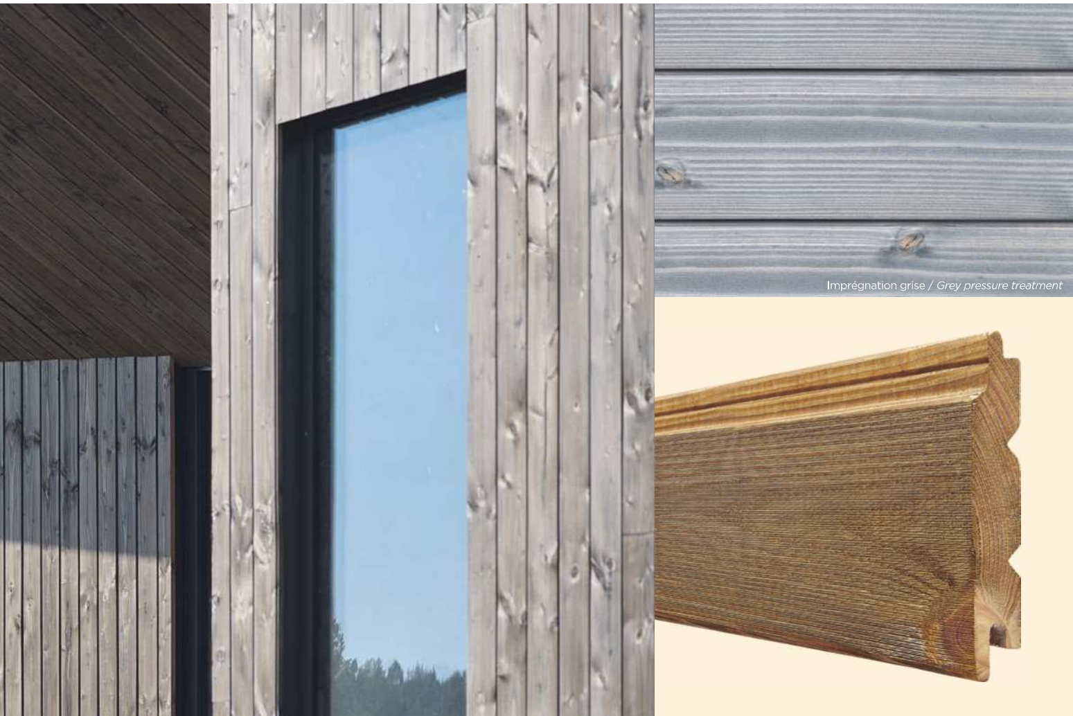
Imprégnation grise / Grey pressure treatment